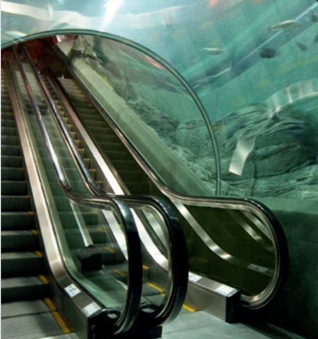
Abb.1: Die Fahrtreppentreppe führt die Besucher durch das Aquarium