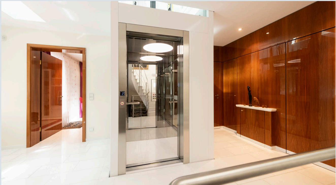
Abb. 1: Wie von Anfang an geplant – die nachträglich ins Gebäude integrierte Schachtkonstruktion fügt sich optimal in die Gesamtarchitektur des Einfamilienhauses ein.