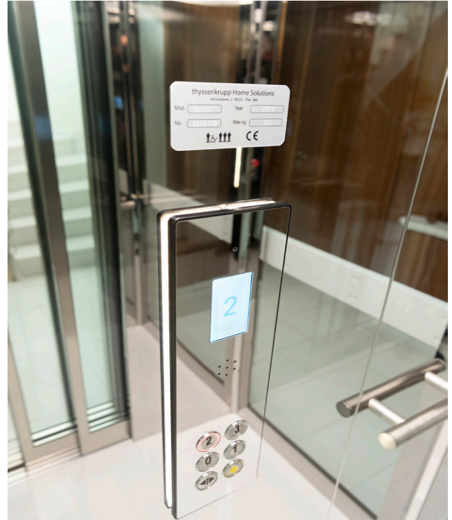
Abb. 3: Zeitlos und elegant – die Bedien- und Anzeigeelemente.