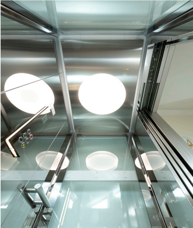
Abb. 2: Lichtdurchflutet durch die vollständige Realisierung der Kabine aus Glas.